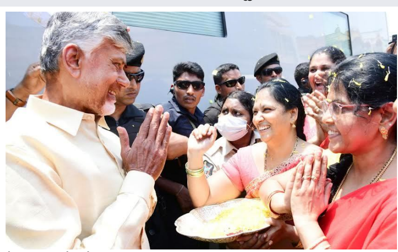
చేసినా సహించేది లేదన్నారు చంద్రబాబు. పిల్లలను మంచి పౌరులుగా తల్లిదంఁడులు తీర్చిదిద్దాలి. తప్పు చేసిన వాళ్ల విషయంలో