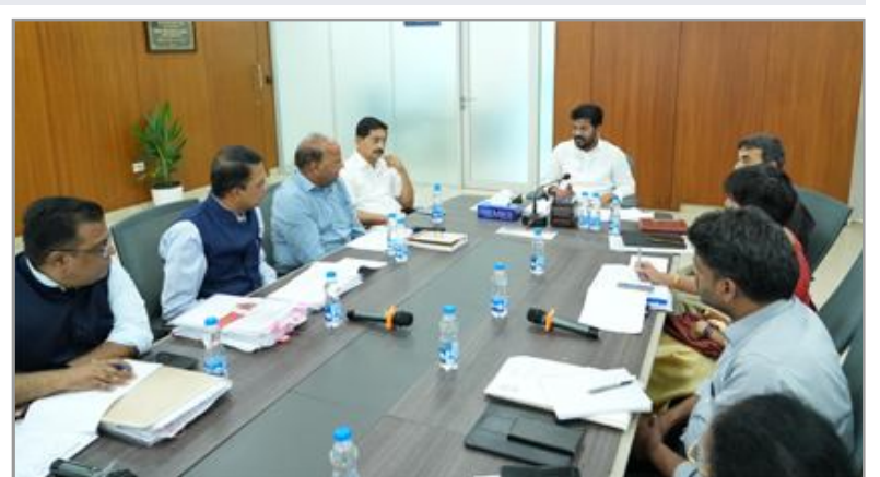
విస్తరించేందుకు కొత్త ప్రణాళిక సిద్ధం చేయాలని అధికారులను రేవంత్ రెడ్డి ఆదేశించారు. దాదాపు 30 వేల ఎకరాల

హైదరాబాద్ ఫ్యూచర్ సిటీ వరకు మెట్రో సేవలను విస్తరించాలని రాడ్లు ప్రభుత్వం ఆదేశించింది. ఇందుకు అవసరమైన తుది ట్రపతిపాదనలు సిద్ధం చేయాలని అధికారులను ముఖ్యమంత్రి రేవంత్ రెడ్డి ఆదేశించారు. కమాండ్ కంట్రోల్ సెంటర్తో మెట్రో విస్తరణపై ముఖ్యమంత్రి సమీక్ష నిర్వహించారు. మెట్రో రెండో దశ విస్తరణకు సంబంధించిన ట్రతిపాదనల పురోగతిని ముఖ్యమంత్రి అడిగి తెలుసుకున్నారు. కేంద్ర ప్రభుత్వం నుంచి అనుమతులు రావాల్సి ఉందని, ఇప్పటికే ధిల్లీలో అధికారులను కలిసి సంప్రదింపులు జరిపినట్లు అధికారులు వివరించారు.ఎయిర్ పోర్టు నుంచి ఫ్యూచర్ సిటీలోని యంగ్ ఇండియా స్కిల్ డెవెలప్మెంట్ యూనివర్సిటీ వరకు 40 కిలోమీటర్ల మేరకు మె(టో