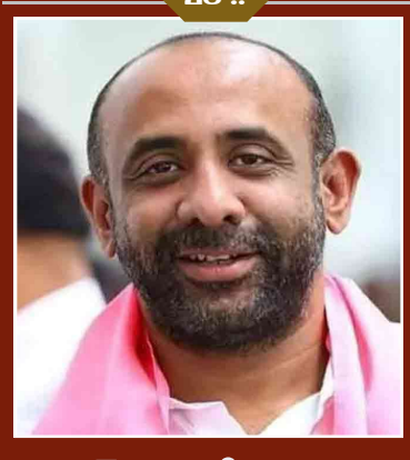
బీఆర్ఎస్ నేత షకిల్ అరెస్ట్