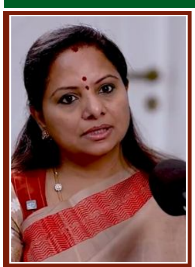
జగన్ మంచి ఫైటర్